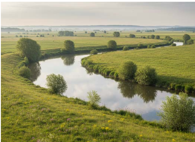
Erstellt mit Gemini 2.5 Flash Image (KI)

Eine besondere hanseatische Reise in die Vergangenheit unserer schönen Metropolenstadt. Historische Bilder und Tonaufnahmen lassen die Stadt an der Elbe lebendig werden. Sie erzählen von ihren Ufern, den Elbauen und prägenden geschichtlichen Vorkommnissen. Unsere Kulturbotschafterin Herma de Buhr lädt Sie ein, Hamburg in alten Fotografien wieder zu entdecken – das Verborgene, das Vergessene und das Bewahrte. Bild und Klang eröffnen neue Perspektiven auf das alte Hamburg und machen Geschichte eindrucksvoll erlebbar.